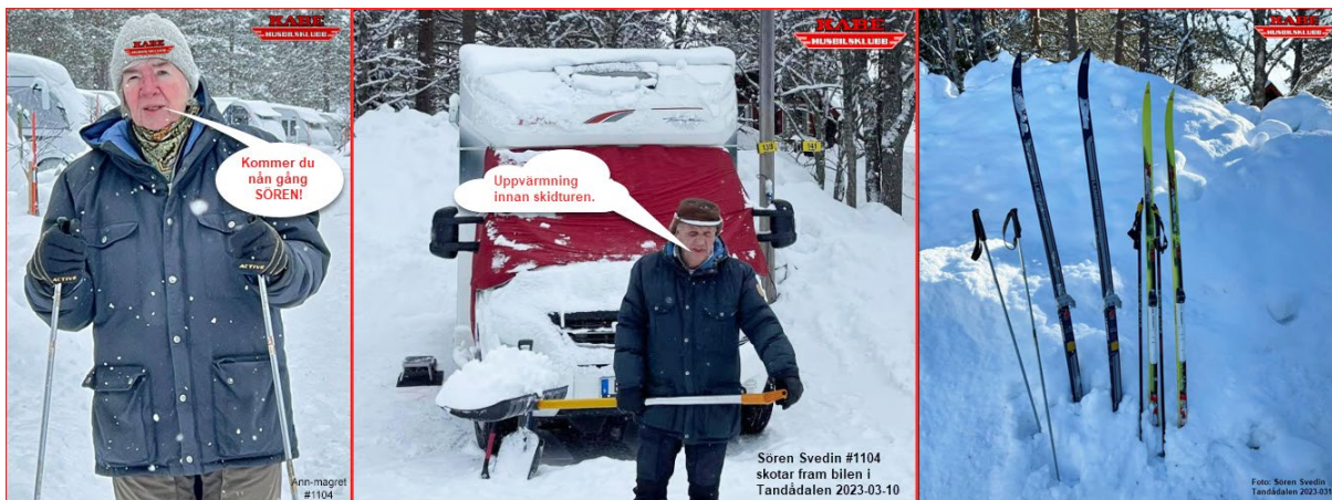
Ann-margret något irriterad!

Sakta och säkert tickar tiden närmre det som för flertalet av oss kallas för "säsongen". Och för oss är det ju just husbilssäsongen vi siktar in oss på. Ett antal av er är duktiga vintercampare som tydligt bevisar att KABE husbilar är bra vinterbilar. Dock, några av er tycker det rinner in lite för mycket kalluft via " torpeden " i bilen. För de av er som gissar på någon form av ammunition finns länken ovan för att få förklaringen. Att råda bot på detta kallas finns det en finsk lösning, som kräver utomhusaktivitet. Några av er har investerat i KABE:s original plisserat vintertäcke för en dyr peng. Tror t.om. att något märke har konvektorer framtill för att hålla fossingarna varma.