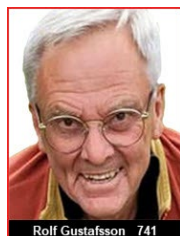
Ordförande KABE Husbilsklubb